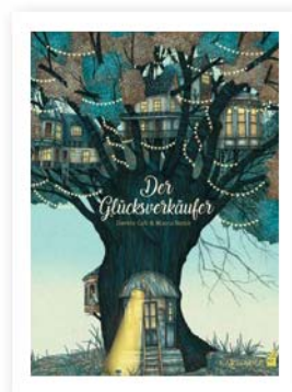
Davide Cali, Marco Somà, Der Glücksverkäufer, Carl-Auer Verlag